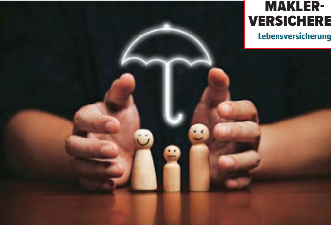
GESCHÜTZT: die passende Lebensversicherung zur Absicherung